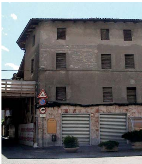
L'edificio prima della ristrutturazione

Nel centro del paese di Nomi c'è una piazza che ha una storia lunga e a lieto fine. Si chiama Springa e sui suoi lati trova posto il Municipio, la Famiglia Cooperativa e ora anche la nuova sede della Cassa Rurale Alta Vallagarina.