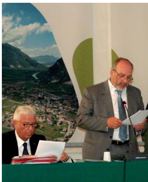
Presidente e Direttore nel corso dell'ultima assemblea dei soci

Certo, già da prima che lo Stato lo suggerisse, noi abbiamo previsto la sospensione tem-