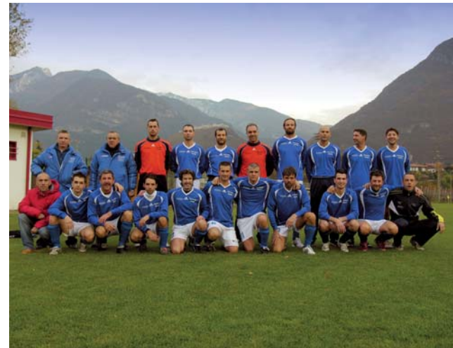
La formazione 2009-2010 del gruppo Amatori Calcio Besenello