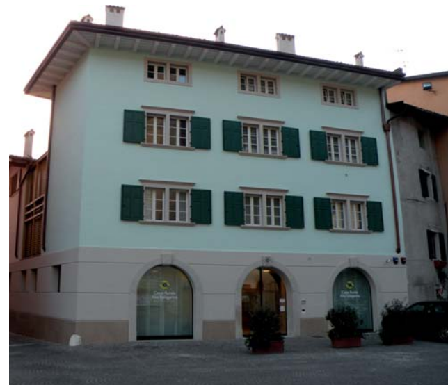
La nuova sede della Cassa Rurale

Il progetto ha preso il via nel 2003, ma i lavori sono iniziati solo nel maggio del 2008 e sono terminati nel settembre 2009, dopo numerose e prolungate soste dovute all'imperversare del maltempo. Ora guardando l'edificio si vede una struttura dallo stile elegante e tra-