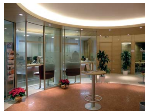
L'interno della nuova sede

dizionale, la sua base è solida com'è solida la Cassa Rurale che vi risiede, salendo nei piani sovrastanti s'incontrano la bellezza delle finestre bifore con le imposte in legno e i contorni in pietra, e la leggerezza della parte superiore che porta le vibrazioni della luce fino al cornicione del sottotetto.