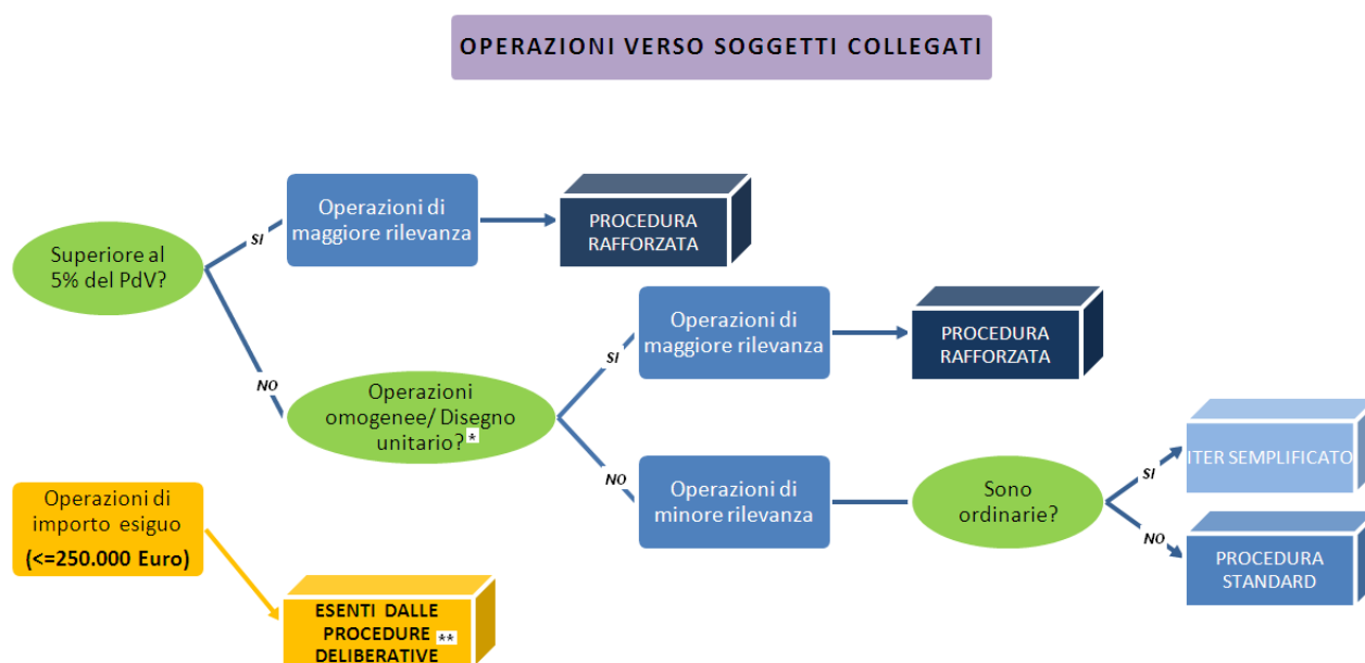
Figura 1: Schema per la classificazione delle operazioni con soggetti collegati.

Di seguito, si riporta uno schema che riassume sinteticamente il processo logico che conduce all'individuazione della tipologia di operazione con soggetti collegati e, di conseguenza, l'iter procedurale alla quale la stessa operazione è soggetta.